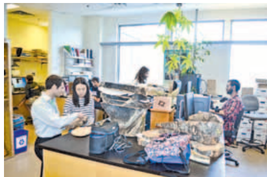
暑假進修有助外國學生，瞭解加國專上教育。